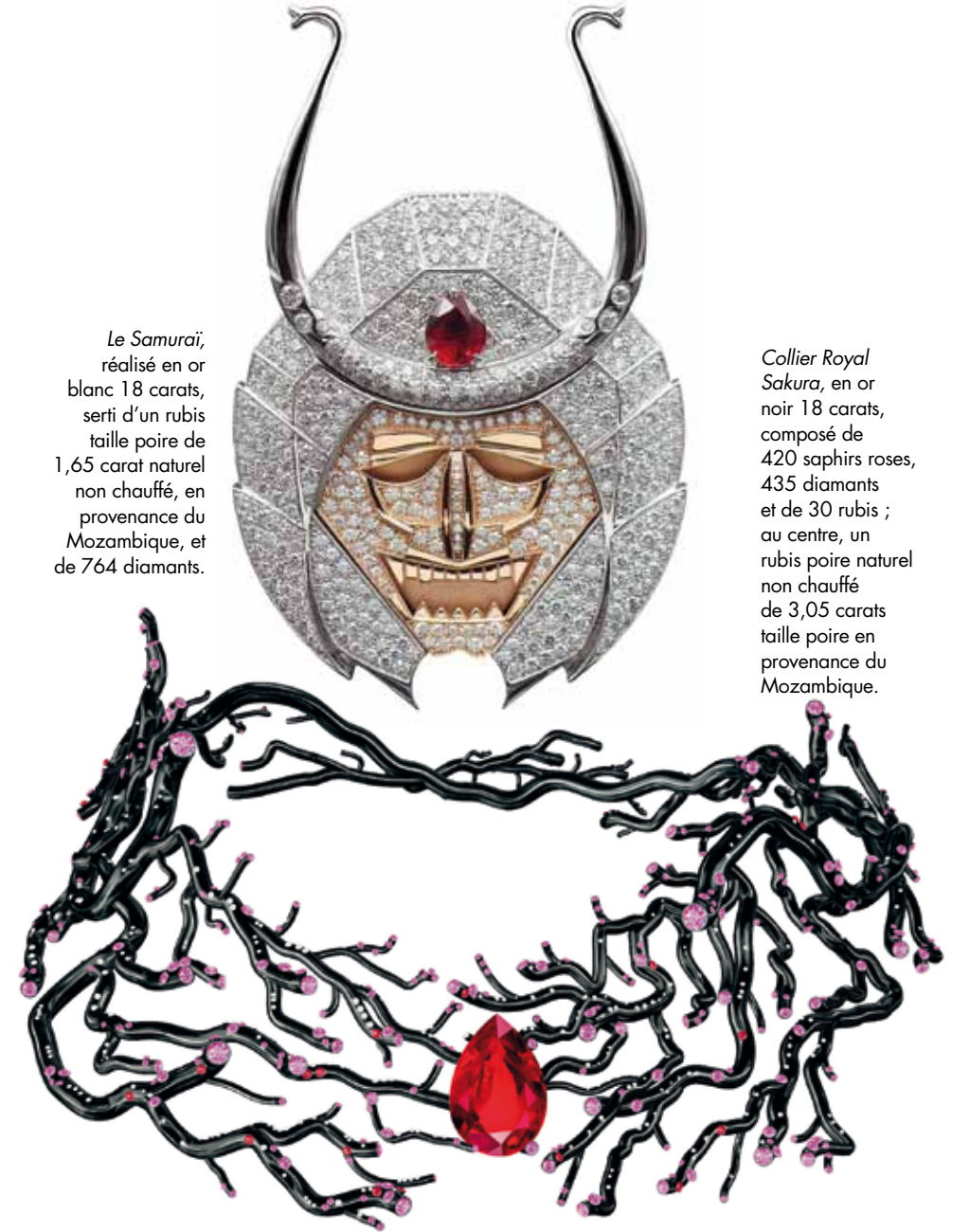
Le Samurai, réalisé en or blanc 18 carats, serti d'un rubis taille poire de 1,65 carat naturel non chauffé, en provenance du Mozambique, et de 764 diamants.

I'm fascinated with the technique of french high-end jewelry and innovation. During the lockdown, I trained on a 3D software. It is a complementary technique to the handmade producing of a piece of jewelry that brings new possibilities regarding geometry and perspectives. It also eases the presentation work for clients that want made-to-measure pieces.